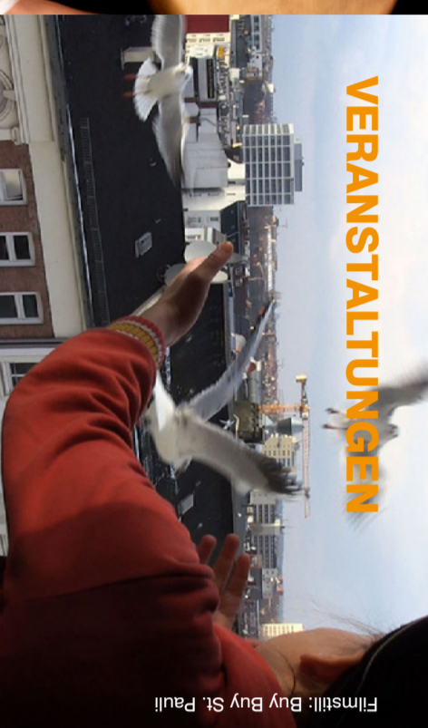
Filmstill: Buy Buy St. Pauli