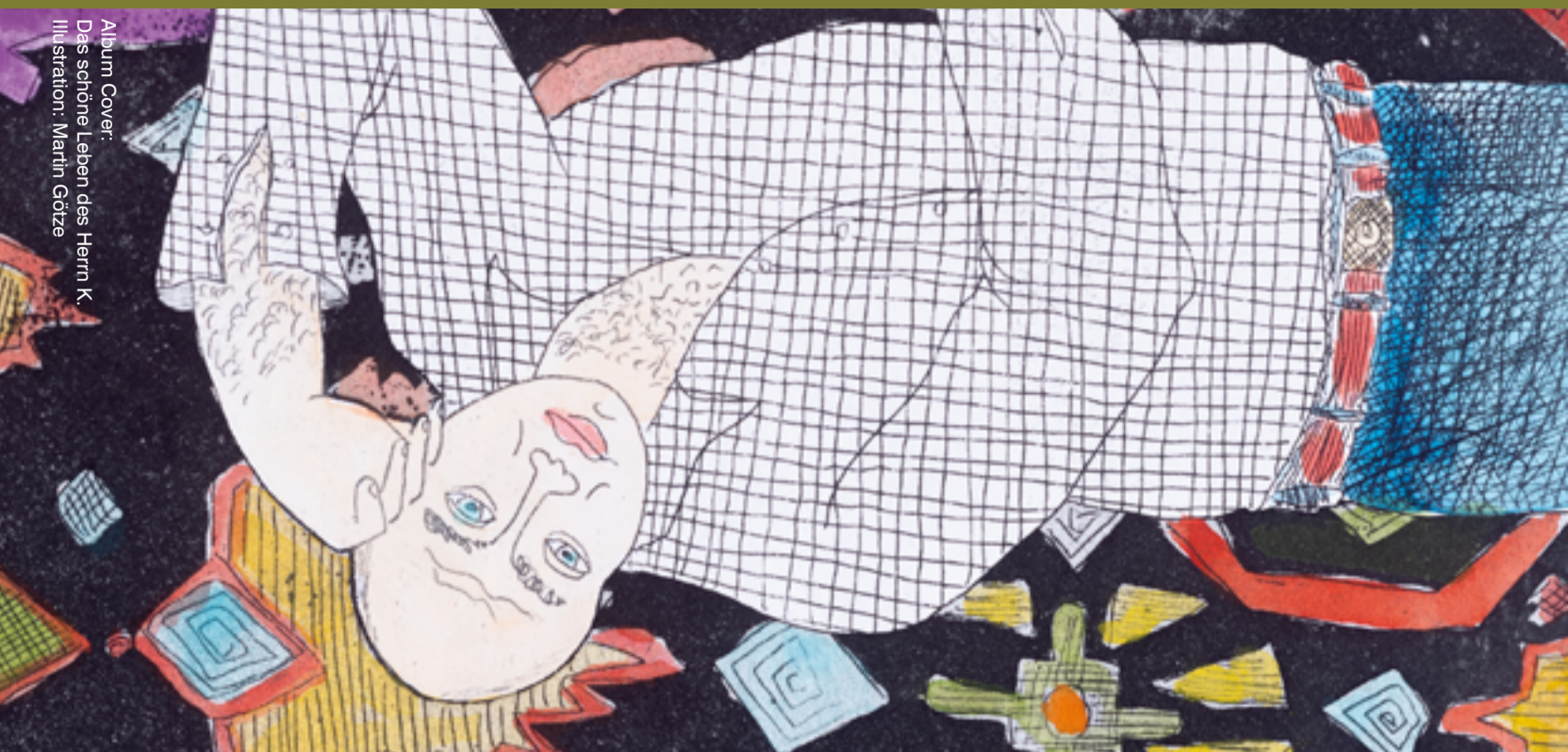
Album Cover: Das schöne Leben des Herrn K. Illustration: Martin Götzke