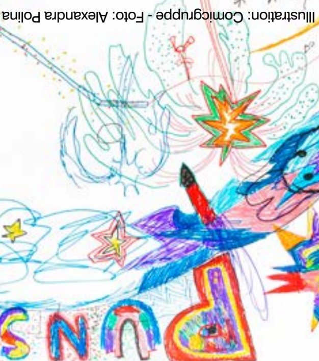
Illustration: Comicgruppe