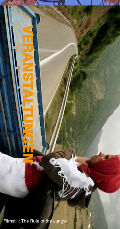
Filmstill: The Rule of the Jungle