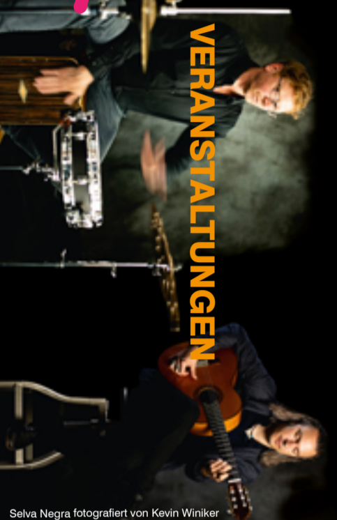
Selva Negra